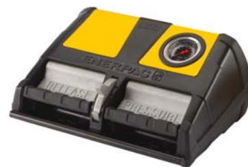
XAシリーズエア駆動油圧ポンプ