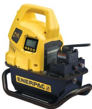
ZU4シリーズ可搬式電動油圧ポンプ