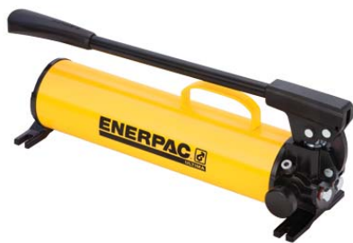
Pシリーズ手動油圧ポンプ

Enerpacはそれぞれのアプリケーションニーズに対応した豊富な油圧ポンプをラインアップしています。間欠運転から連続運転までのさまざまなアプリケーションにマッチングした製品やシステムを提案します。