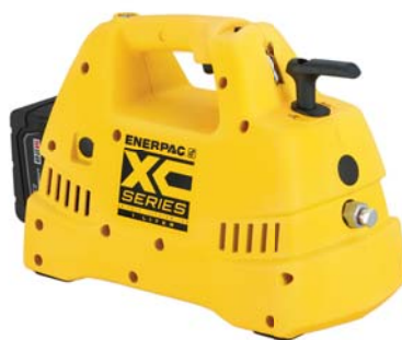
XCシリーズコードレス油圧ポンプ