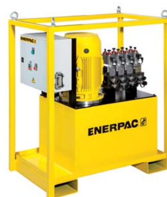
SFPシリーズ同調油圧ポンプ

9583 JP © Enerpac 03-2018 . 予告なく変更されることがあります。