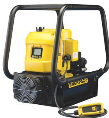
ZEシリーズ電動油圧ポンプ